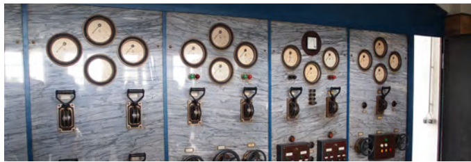
Idee, Konzept und Gestaltung BWK Landesverband NRW e.V.